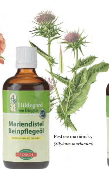
Pestrec mariánsky ( Silybum marianum )