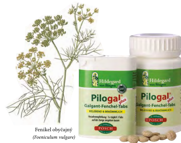
Fenikel obyčajný (Foeniculum vulgare)

Kombinácia: galgantový med, galgantové kvapky, bylinný elixír Meluvin, prášok horca, Horké kvapky