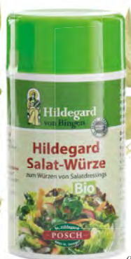
Muskát (Myristica fragrans)