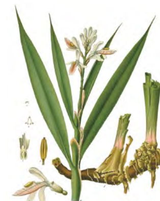
Galgant, Alpinia liečivá (Alpinia officinarum)