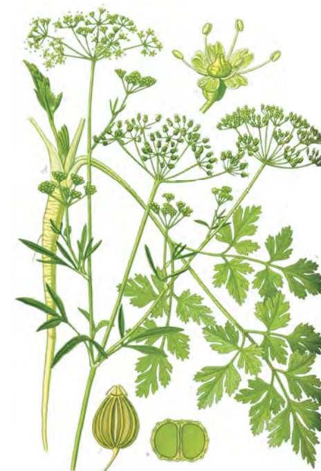
Petržlen ( Petroselinum crispum )

Kombinácia: Galgant (alebo tablety Pilogal), Jastrabník, feniklové tablety (Pilofen), Horké kvapky, masť z olivových listov