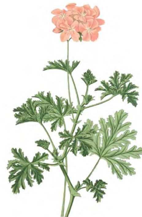
Pelargónia ( Pelargonium graveolens )