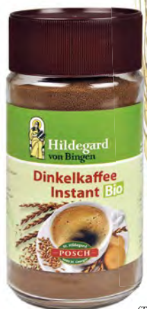
Špalda (Triticum spelta)