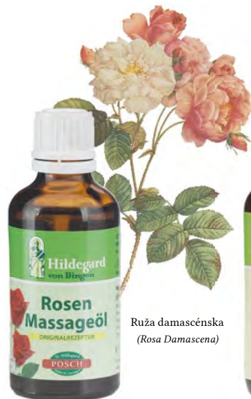
Ruža damascénska ( Rosa Damascena )