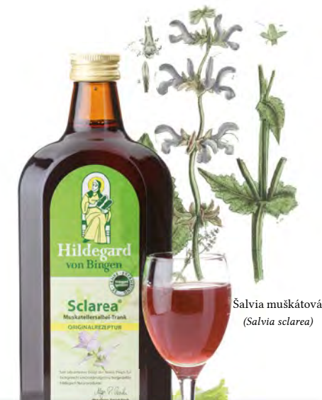
Šalvia muškátová ( Salvia sclarea )

„Ten, kto sa nemôže vymočiť, ale netrpí pritom na močový kameň, nech často pije tento nápoj a zadržovanie moču sa uvoľní.“ – Hildegarda z Bingenu