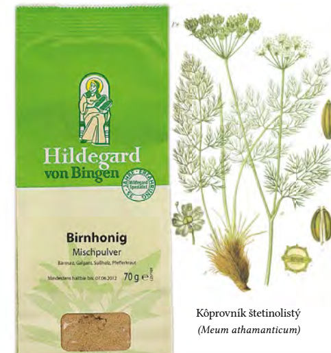
Kôprovník štetinolistý ( Meum athamanticum )