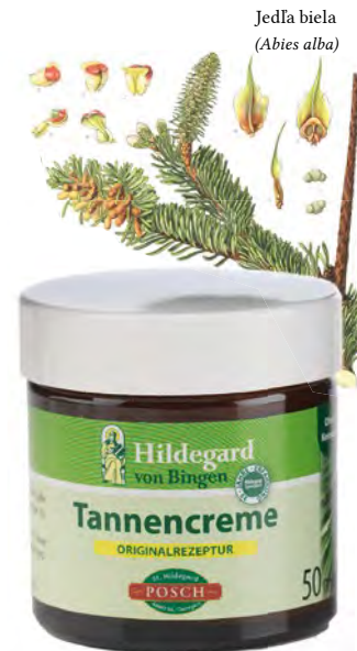
Jedľa biela ( Abies alba )