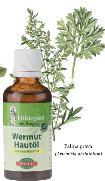
Palina pravá ( Artemisia absinthium )