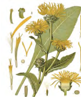
Oman pravý ( Inula helenium )

Kombinácia: Palinový hrudný olej, vavrínový prášok, šalviový prášok (alebo tablety)