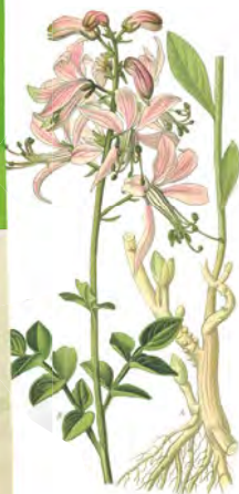
Diptam, Jasenec biely ( Dictamnus albus )

„Jastrabník pri jedení posilňuje srdce a znižuje zlé šťavy, ktoré sú uväznené v človeku na jednom mieste. Ale keď človek chce jesť jastrabník, mal by pridať niečo z koreňa diptamu alebo trochu galgantu alebo trochu cicváru a jesť to spolu s tým.“ – Hildegarda z Bingenu