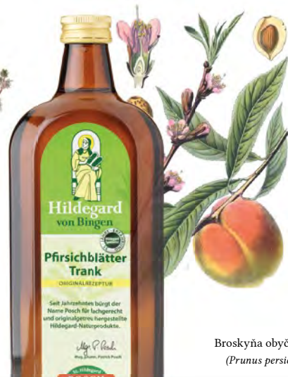
Broskyňa obyčajná ( Prunus persica )

„Pi toto víno často a vyčistí ti žalúdok, črevo a vyjasní tvoje oči, pretože mäta má príjemné teplo a silu 15 bylínok v sebe.“ – Hildegarda z Bingenu