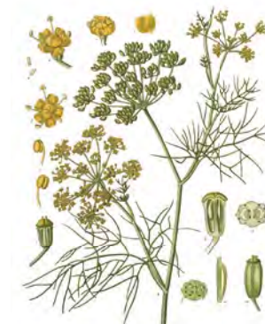
Fenikel obyčajný ( Foeniculum vulgare )