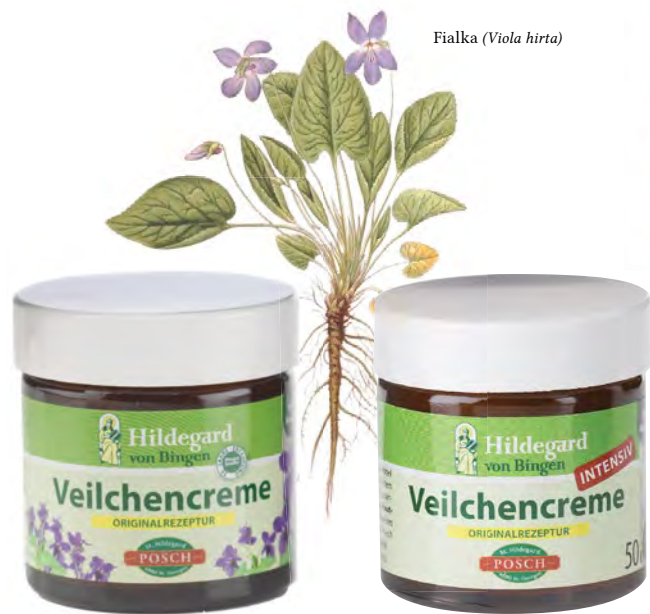
Fialka ( Viola hirta )