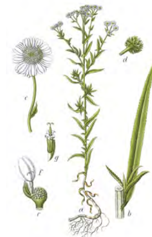
Bertram, Trahok rímsky ( Anacyclus pyrethrum )