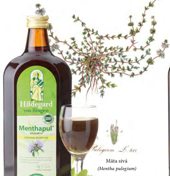
Mäta sivá ( Mentha pulegium )

„Pi toto víno často a vyčistí ti žalúdok, črevo a vyjasní tvoje oči, pretože mäta má príjemné teplo a silu 15 bylínok v sebe.“ – Hildegarda z Bingenu