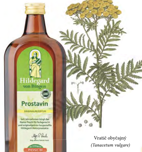
Vratič obyčajný ( Tanacetum vulgare )

„Koho trápi dna alebo reuma, ten má piť toto víno ráno, večer a v noci, a reuma ho opustí.“ – Hildegarda z Bingenu