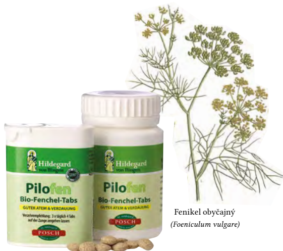
Fenikel obyčajný ( Foeniculum vulgare )