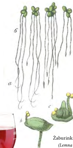
Žaburinka menšia ( Lemna minor )

„Keď sa žaburinka pripojí k iným silným prostriedkom, mierni neužitocné šťavy u človeka. Ten nech pije žaburinkový nápoj často na lačný žalúdok a večer, keď si ľiha do postele. Tým sa zabráni, aby zlé šťavy vznikali.“ – Hildegarda z Bingenu