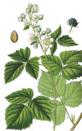
Ostružina černicová ( Rubus fruticosus )