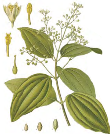
Škoricovník cejlónsky ( Cinnamomum verum )

„Vino z jelenieho jazyka pi často pred jedlom a po jedle. Pomáha pečeni, čistí pľúca, lieči vnútornosti a odstraňuje vnútorné hnisanie a zahlienenie.“ – Hildegarda z Bingenu