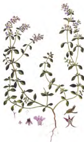
Materina dúška vajcovitá (Thymus pulegioides)