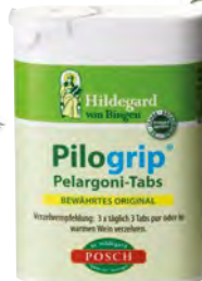
Pelargónia ( Pelargonium graveolens )