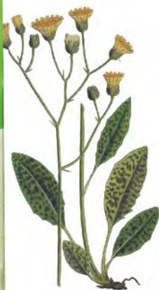
Jastrabník ( Hieracium vulgatum )