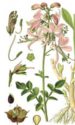
Diptam, Jasenec biely ( Dictamnus albus )