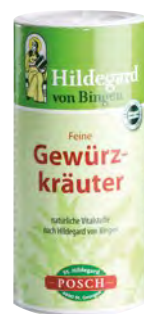
Ligurček lekársky (Levisticum officinale)