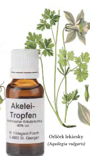
Orlíček lekársky ( Aquilegia vulgaris )