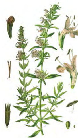
Yzop lakársky ( Hyssopus officinalis )