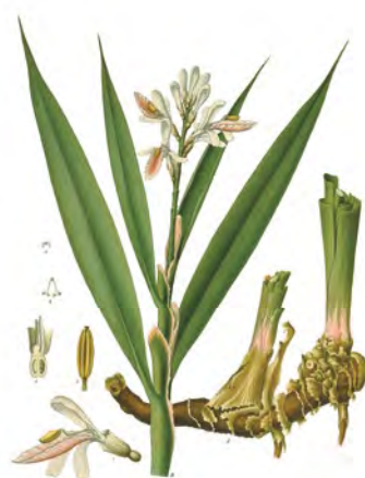
Galgant, Alpinia liečivá (Alpinia officinarum)

Kombinácia: na vyrážky Kré z materinej dúšky