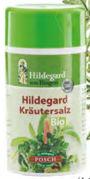
Palina dračia (Artemisia dracunculus)