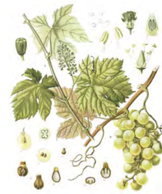
Vinič hroznorodý ( Vitis vinifera )