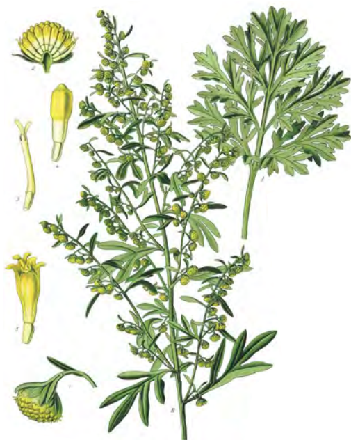
Palina pravá ( Artemisia absinthium )

Užívanie pri jarnej očistnej kúre od mája do októbra: každý tretí deň pred raňajkami nalačno 1 likérový pohárik (60 ml); odporúčané množstvo – 8 fliaš