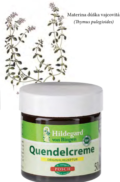
Materina dúška vajcovitá ( Thymus pulegioides )