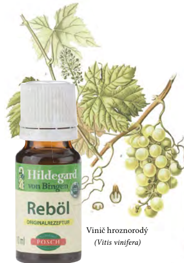
Vinié hroznorodý ( Vitis vinifera )