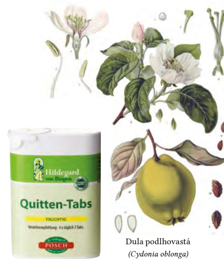
Dula podlhovastá ( Cydonia oblonga )