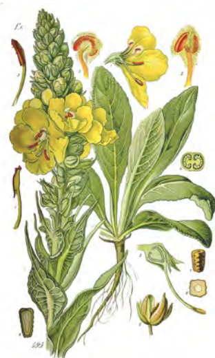
Divozel veľkokvetý ( Verbascum densiflorum )