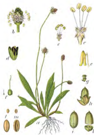
Skorocel kopijovitý ( Plantago lanceolata )

Kombinácia: zelerová zmes, dulové tablety (Quitten), elixír Krauseminzen, palinová masť, Hruškový med